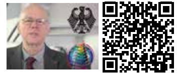
Schuchardts Komplementär-Spirale Reichstags-Kuppel Integrations-Gipfel Culture-Parade '7