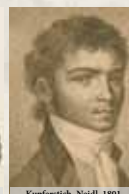
Kupferstich, Neidl, 1801