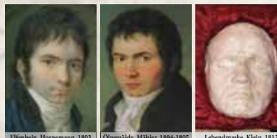
Ellenbein, Hornemann, 1803