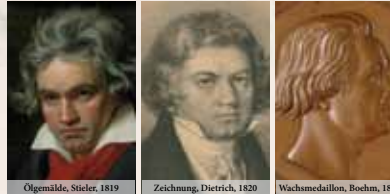
Ölgemälde, Stieler, 1819