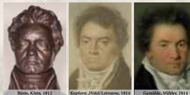
Biaste, Klein, 1812