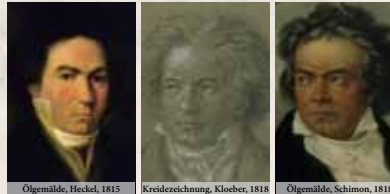
Ölgemälde, Heckel, 1815