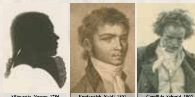
Silhouette, Neesen, 1786