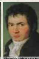
Ölgemälde, Mähler, 1804-1805