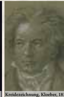
Kreidezeichnung, Kloeber, 1818