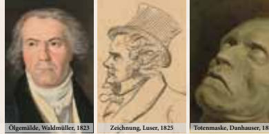
Ölgemälde, Waldmüller, 1823