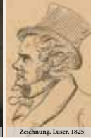
Zeichnung, Luser, 1825