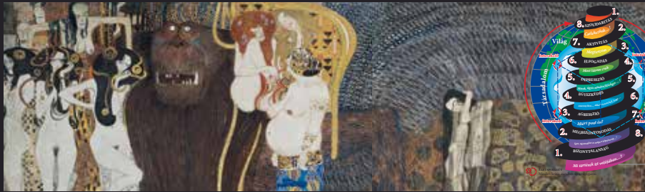
A ROMLÁS kínjai

„Gyűlj ki, égi szikra lángja ... Gyűljön csók az ajkakon”