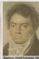
Kupferst. Höfel/Letronne, 1814