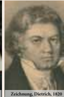
Zeichnung, Dietrich, 1820